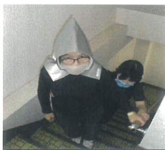
階段昇降可能な方は安全に階段避難。リハビリにもなります。