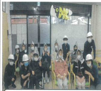
津波若しくは大雨での氾濫により水害が発生しました！

年2回実施しております避難訓練ですが、3月は毎年、大雨や台風での水害に備えた避難訓練を実施しています。水害避難訓練なので屋上に向け避難するため、階段昇降が大変ですが、新型コロナウイルス感染に十分に配慮し、できる方には頑張ってくださいました。ご協力くださいましたご利用者の皆様ありがとうございました。これからの台風時期でも安心です！