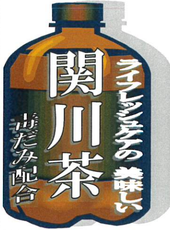
こんなにたくさん飲めるかな～

デイサービスからのお祝いは、毎年恒例のご利用者の名前入り飲料水。今年はなんと！2Lの～ライフレッシュの美味しいお茶～。皆さんには重たいでしょうが2Lのペットボトルをお持ち帰りいただきました。ご自宅でもしっかりと水分補給。