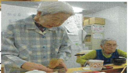
おりましたが、少しずつ再開しております。