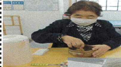
お点前でした。コロナ感染予防のためイベント自粛が続いて